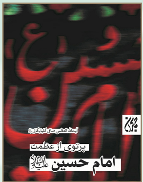
پرتوی از عظمت امام حسین علیه السلام ناشر: کتاب جمکران؛ تعداد صفحات: ۴۸۸

این کتاب ثمره بخشی از مجاهدت های علمی ایشان در راستای معرفی شخصیت سیدالشهدا علیه السلام و تبیین ریشه ها، ابعاد و نتایج نهضت حسینی است. اثری که عنوان کتاب سال ولایت را به خود اختصاص داد.