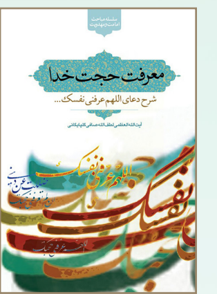
معرفت حجت خدا (شرح دعای اللهم عرفنی نفسک) ناشر: کتاب جمکران؛ تعداد صفحات: ۱۲۴

معتبرترین احادیث در منابع شیعه و سنی در ده فصل گردآوری شده و نیز در پاورقی کتاب توضیحاتی به فراخور، از سوی پدیدآور ارائه شده است. این اثر که شاید بتوان گفت مهم ترین دایره المعارف حدیثی مهدویت در دوران معاصر است، برنده جوایز کتاب سال ولایت و کتاب سال مهدویت شده است.