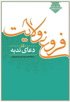
فروع ولایت در دعای ندبه ناشر: دفتر تنظیم و نشر آثار حضرت آیت الله العظمی حاج شیخ لطف الله صافی گلپایگانی؛ تعداد صفحات: ۱۹۴

ایشان در بخشی از پیش گفتار، دلیل نگارش این اثر را چنین بیان داشته اند: «در زمان ما بیشتر افکار روی تحلیل حوادث و علل و نتایج وقایع حساب می نمایند، و عظمت حوادث تاریخی را از این راه اندازه گیری می کنند و کتاب هایی که موضوع آن تحلیل حوادث تاریخی باشد برایشان جالب تر و بیشتر مورد توجه خوانندگان و نسل جوان و روشنفکران واقع می شود.»